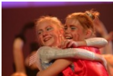
Strahlende Oscar-Gewinner beim Bundesfinale 2002 in Leipzig.